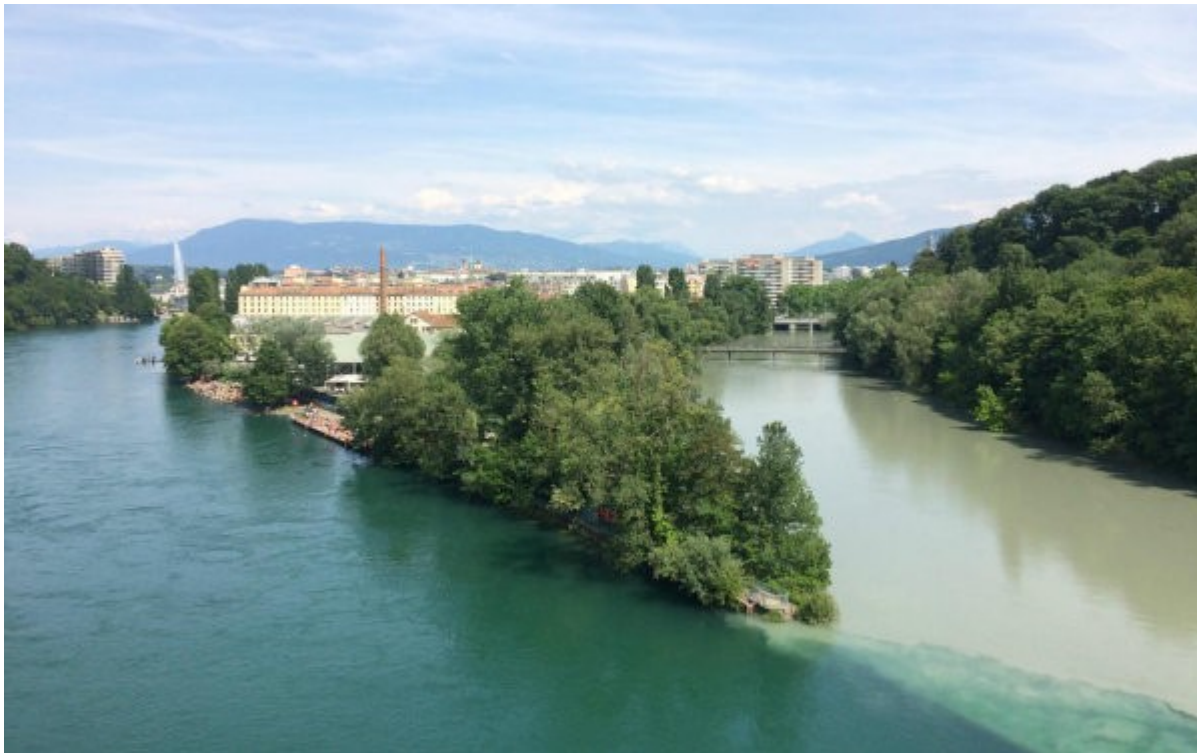
Le parc s'étendrait de l'usine Kugler à la fin de la Jonction.

L'aménagement de la pointe de la Jonction a donné lieu à plusieurs projets, qui ont fini par être abandonnés. En 2008, une école de sciences et des arts était annoncée. Elle aurait vu pousser un pont consacré aux neurosciences regroupant de la Haute école d'arts et de design et la Haute école de musique, ainsi que des logements étudiants. En 2015, un projet au niveau du canton prévoyait des appartements, bureaux et un toit du dépôt des TPG.